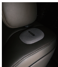
5cm Personal™ サラウンドスピーカー